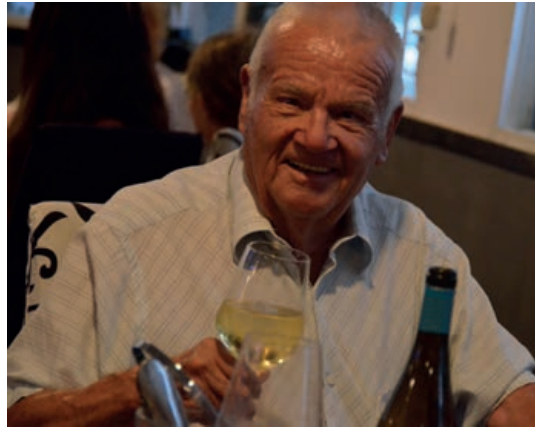
Trotz COVID-Pandemie, oder vielleicht gerade deshalb: «Ein Schlückchen in Ehren kann niemand verwehren!» - Malgré la pandémie de coronavirus, on peut-être à cause de cette dernière: «Un petit verre n'a jamais fait de mal à personne!»