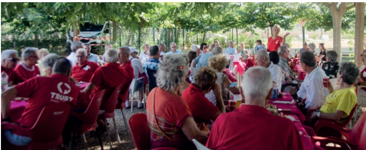
Die Bundesfeiern wurden wann immer und so gut wie möglich begangen. - Les célébrations pour le 1er août ont été organisées quand cela était possible.