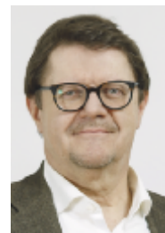
IVO DÜRR, REDAKTION

Hier wie dort scheint unser Milizsystem an seine Grenzen zu kommen: Die Bereitschaft sich „pour la patrie“ einzusetzen schwindet. Insbesondere die jüngere Generation ist oft nicht mehr bereit – oder richtiger gesagt – häufig nicht mehr in der Lage dazu: Die heutige Arbeitswelt, die gesellschaftlichen und demographischen Veränderungen, das neue Rollenverständnis von Mann und Frau, aber auch die moderne Kommunikation lassen die Freiräume (oder einfach die Zeit) für freiwilliges Engagement dahin schmelzen wie unsere Gletscher unter der Klimaerwärmung. Um mögliche Auswege zu finden, organisiert der Gemeindeverband heuer schweizweit Veranstaltungen mit Partnern aus verschiedenen Sektoren: Diskussionen zwischen Experten und der Öffentlichkeit sollten Impulse für Reformen geben, die notwendig sind, um das Milizsystem zu stärken und zu entwickeln. Vielleicht fallen dabei auch Ideen und Impulse für die Vereine ab? Es lohnt sich, immer wieder einmal auf swissinfo.ch zu gehen und sich zu informieren. Die Plattform ist Medienpartner des „Jahres der Milizarbeit“ und wird regelmässig Artikel zu diesem Thema veröffentlichen.