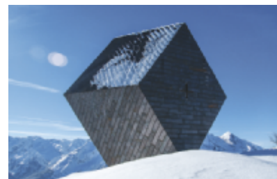
Granatkapelle, Penkenjoch, Zillertal, Österreich (2011–2013)

Botta schuf Bauwerke auf der ganzen Welt: vom Einfamilienhaus in der Schweiz über Bibliotheken in Dortmund und Peking bis zu Bankgebäuden in Athen und einem Museum in San Francisco. Ein Leben für die Architektur, mit einer großen Liebe für Sakralbauten: Bottas Werk umfasst katholische Kapellen und Kirchen in Italien, der Schweiz, Frankreich und in Österreich (im Zillertal in Tirol), aber auch eine Synagoge in Israel. Im Bau befinden sich eine Moschee in China