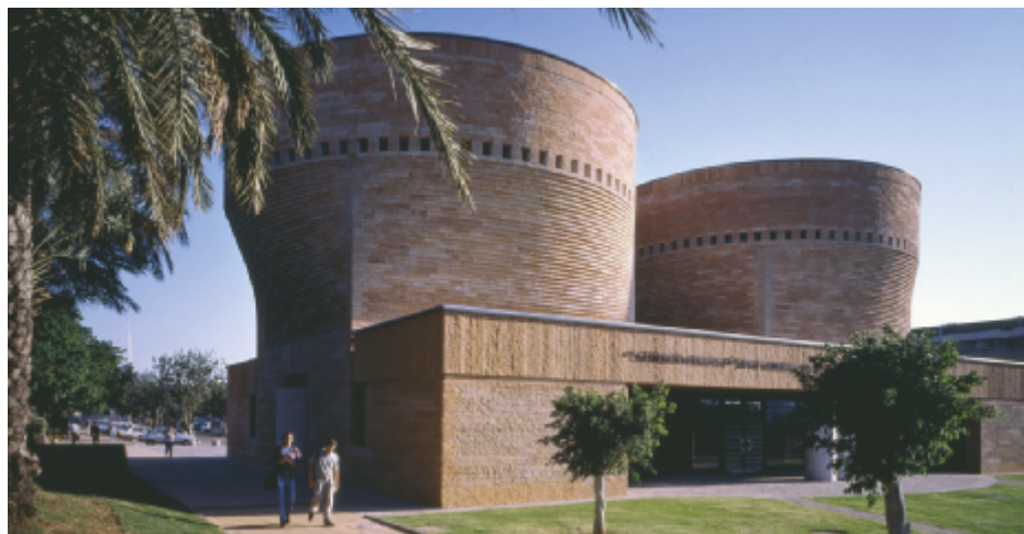
Cymbalista-Synagoge und jüdisches Kulturzentrum, Tel Aviv, Israel (1996–1998)