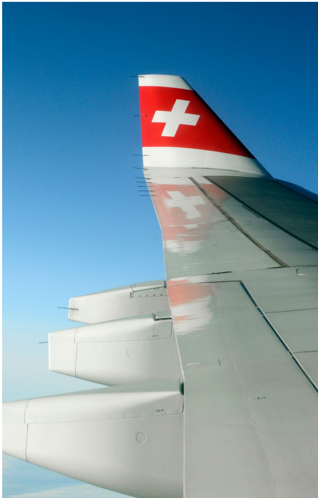
Die Swiss fliegt in einem Hoch. Ihr operativer Gewinn dürfte für das Jahr 2017 über 500 Millionen Franken betragen.

Im Vergleich zur ausländischen Konkurrenz mag die Swiss zwar teuer sein. Aber ganz offensichtlich sind die Kunden bereit, Ticketpreise zu bezahlen, die solche Gewinne ermöglichen. Die starke Konkurrenz hält die Swiss freilich in Schach. Easyjet Switzerland, eine Tochtergesellschaft der gleichnamigen britischen Lowcost-Airline, ist die zweitgrösste Fluggesellschaft im Lande. Easyjet fliegt mit einer Schwei-