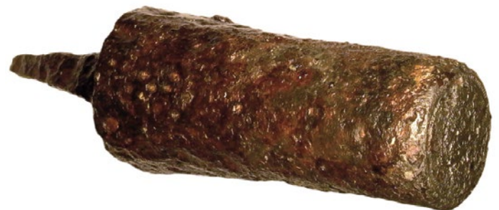
Unterstempel für die Hammerprägung der anonymen Denare des Bistums Lausanne. Gepräge unleserlich, 14. Jahrhundert.