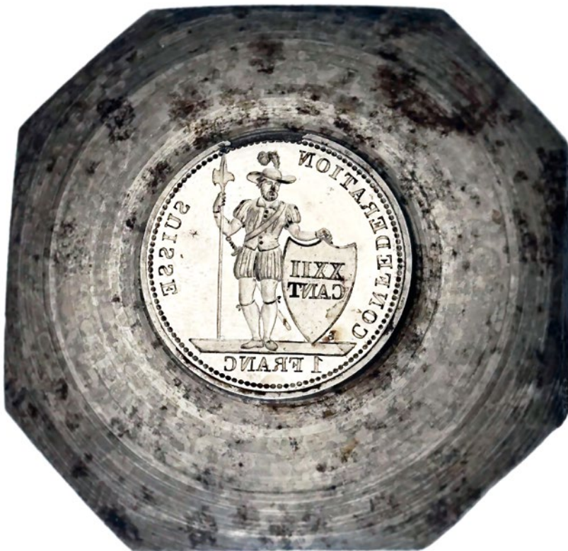
Stempel für die Stosswerkprägung einer Ein-Schildfranken-Münze. Kanton Waadt, Lausanne, 1846.