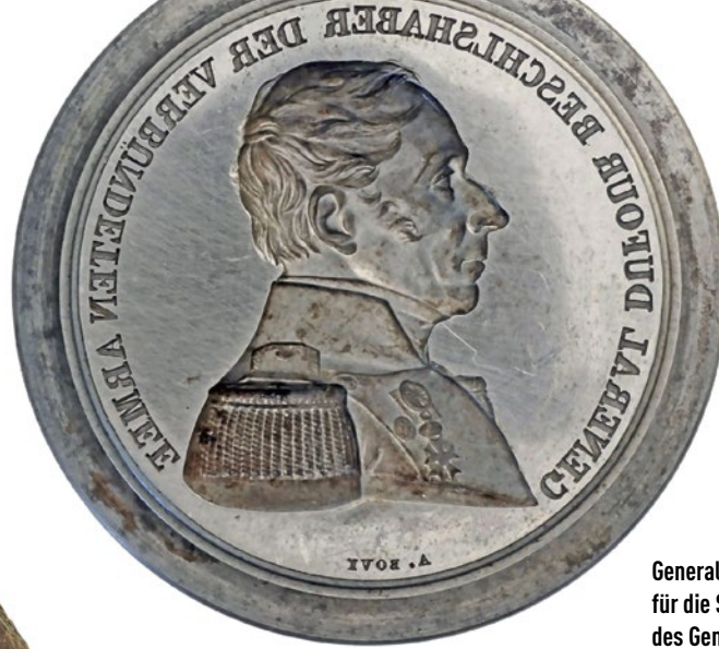
Generalsmedaille aus Stahl: Aversstempel für die Stosswerkprägung einer Medaille des Generals Dufour durch den Stempelschneider Antoine Bovy. Genf, 1846.