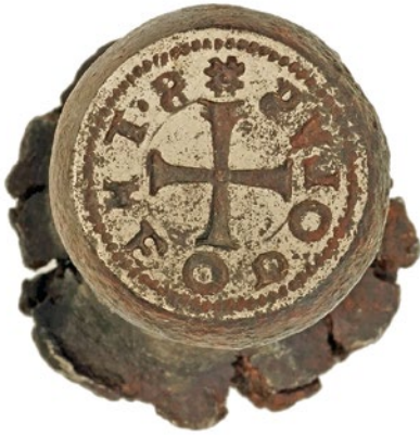
Ein Kreuzer aus Eisen: Oberstempel für die Hammerprägung. Bistum Sitten, Hildebrand I von Riedmatten (1565-1604), Sitten.