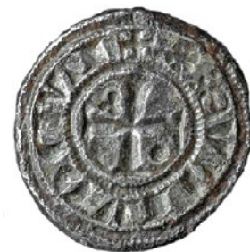
Obereisen für die Hammerprägung der Denare des Barons von Waadt, Ludwig II, 14. Jahrhundert., in Rovray gefunden.