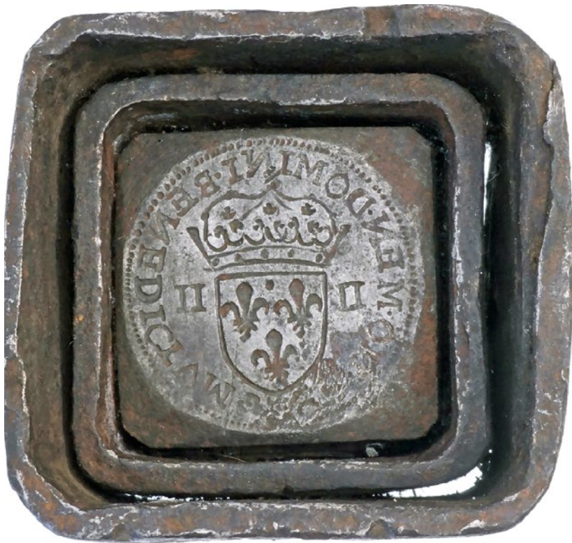
Obereisen für die Klippwerk- oder Stosswerkprägung eines Viertel-Talers. Königreich Frankreich, Heinrich IV (1589-1610), unbekannte Werkstatt.

Musée Monétaire: Palais de Rumine (3 e niveau), Place de la Riponne 6, Lausanne. www.musee-monetaire.ch