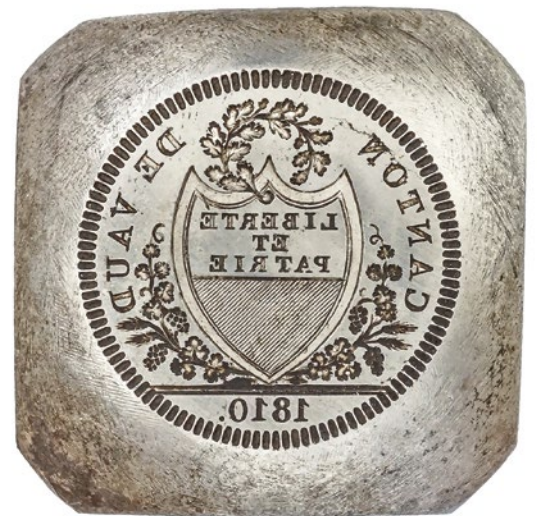
Avers- und Reversstempel für die Stosswerkprägung einer 20-Batzen-Münze. Kanton Waadt, Lausanne, 1810.