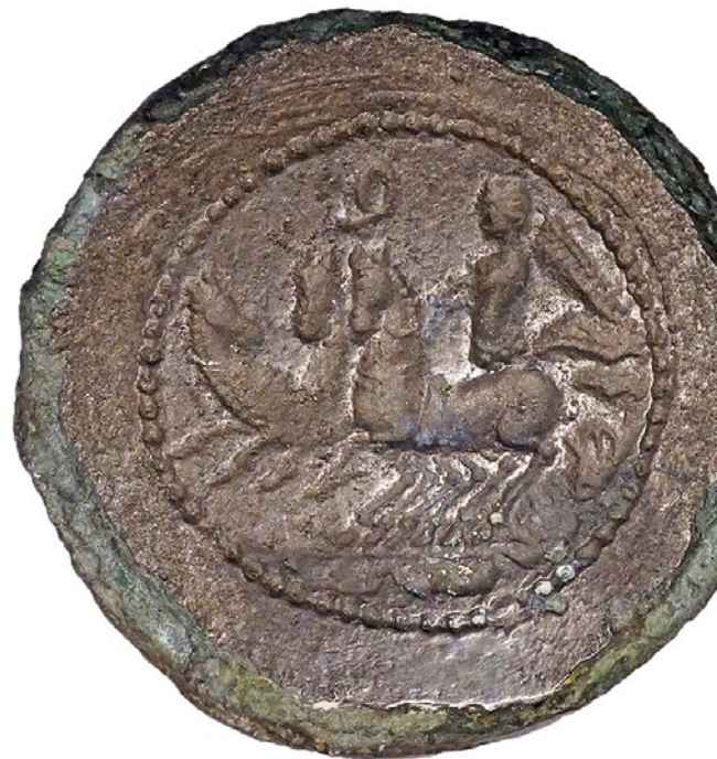
Antiker Bronze-Fund: Münzprägungestempel für die Hammerprägung eines Denars von Naevius Balbus, 79 v. Chr.