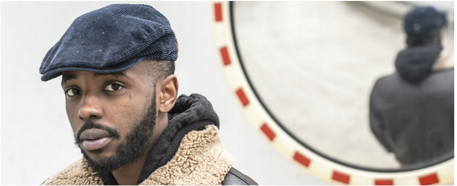
Makala ist einer der neuen Stars der Schweizer Hip-Hop-Szene. Sein Rap ist das Produkt eines Genf der Vorstädte.

Produzent. In «Vision nocturne» erzählt sie von sich selbst. «J'arrête quelqu'un dans la rue, une fois sur deux, j'sens sa méfiance.» / «Wenn ich jemanden auf der Strasse anspreche, spüre ich bei jedem Zweiten Misträuen.» «La Suisse ne connaît pas son histoire, s'en tape de celle des autres.» / «Die Schweiz kennt ihre Geschichte nicht und pfeift auf die der anderen.» «Vote pour chasser l'immigrant sauf s'il transpire dans un maillot.» / «Stimmt dafür, dass Einwanderer rausgeworfen werden, ausser die im Trikot.» «J'habite en Valley, p't'être que c'est l'endroit parfait pour en parler.» / «Ich lebe im Wallis, das ist vielleicht der ideale Ort, um darüber zu reden.» «Des guerres non déclarées entre villes, villages et mêmes quartiers.» / «Nicht erklärte Kriege zwischen Städten, Dörfern oder sogar Quartieren.» «T'aimes pas ton voisin, dur d'accepter l'étranger.» / «Wenn du deinen Nachbarn nicht magst, ist es schwer, Ausländer zu akzeptieren.»