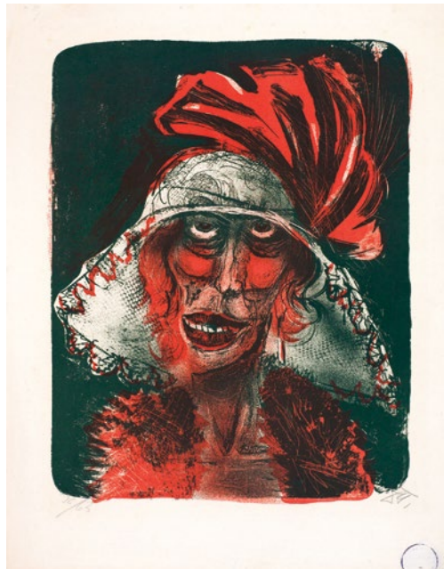
«Entartete Kunst» aus Cornelius Gurlitts Sammlung: «Leonie» von Otto Dix, eine expressionistische Farblithografie aus dem Jahr 1923.

Das Kunstmuseum Bern zeigt bis 4. März die Gurlitt-Ausstellung zur «entarteten Kunst», danach jene zur Raubkunst aus der Bundeskunsthalle Bonn.