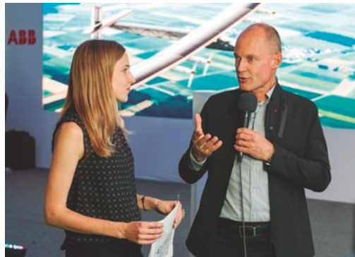
Dr. Bertrand Piccard explicando su proyecto Solar Impulse II

cuente manera de hablar y su discurso positivo y motivador para el futuro, tocaron a cada uno de los presentes. Su mensaje; Change es posible! ...¡El cambio es posible!