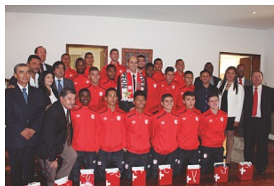
Jugadores y equipo técnico. En el centro el Sr. Embajador