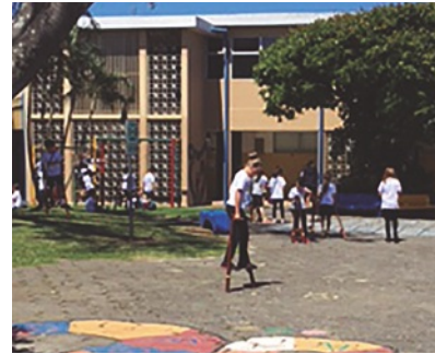
Vista de alumnos en distintas actividades en espacios al aire libre