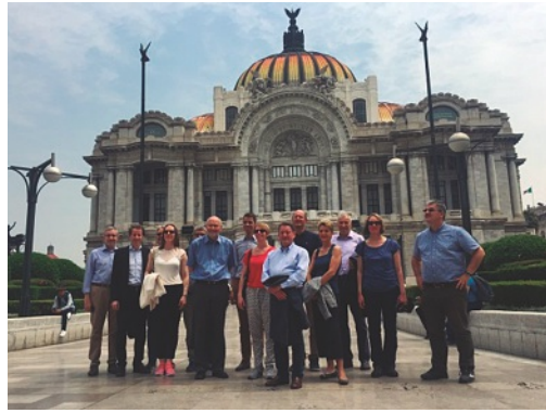
La delegación frente al Palacio de Bellas Artes

El famoso piloto y pionero de aviación solar, Dr. B. Piccard visitó México el 16 y 17 de mayo de 2017 para exponer el gran éxito que tuvo el avión Solar Impulse II con el cual dio la vuelta al mundo sin usar una sola gota de petróleo. Promocionó el desarrollo de tecnologías innovadoras que garanticen un futuro más sostenible; presentó su nuevo proyecto “alianza mundial para energía limpias” que promueve la investigación e innovación en el ámbito de las energías renovables; dio conferencias de prensa, tuvo varias entrevistas y encuentros. El último evento fue en la residencia del Sr. Embajador de Suiza donde hizo una presentación que cautivó a los asistentes; su elo-