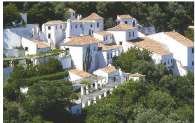
Malerische Ecken im Convento da Arrábida.

Dégustation de bière au petit village de pêcheurs de Sesimbra - la Arrábida Bee Company recueille de bonnes notes.