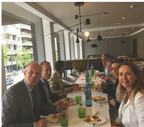
Pause de midi à l'hôtel de la Conférence: Tapas à la rescousse avant le vote des nouveaux membres du Conseil des Suisses de l'étranger.

Beeindruckende Tour: Viele Teilnehmer der Präsidentenkonferenz liessen es sich nicht nehmen, Gaudis berühmte Sagrada Familia zu besuchen.