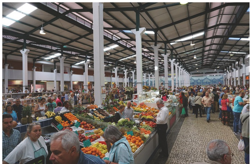
Beeindruckend: Die riesige Markthalle von Setúbal mit ihrem vielseitigen Angebot.

Coins pittoresques au Couvent de Arrábida.