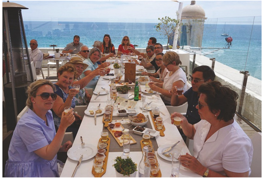
Bier-Degustation im Fischerdörfchen Sesimbra - die Arrábida Beer Company erhält gute Noten.

PATRICK EBERHARD/TRADUCTION: BÉATRICE PEISSARD