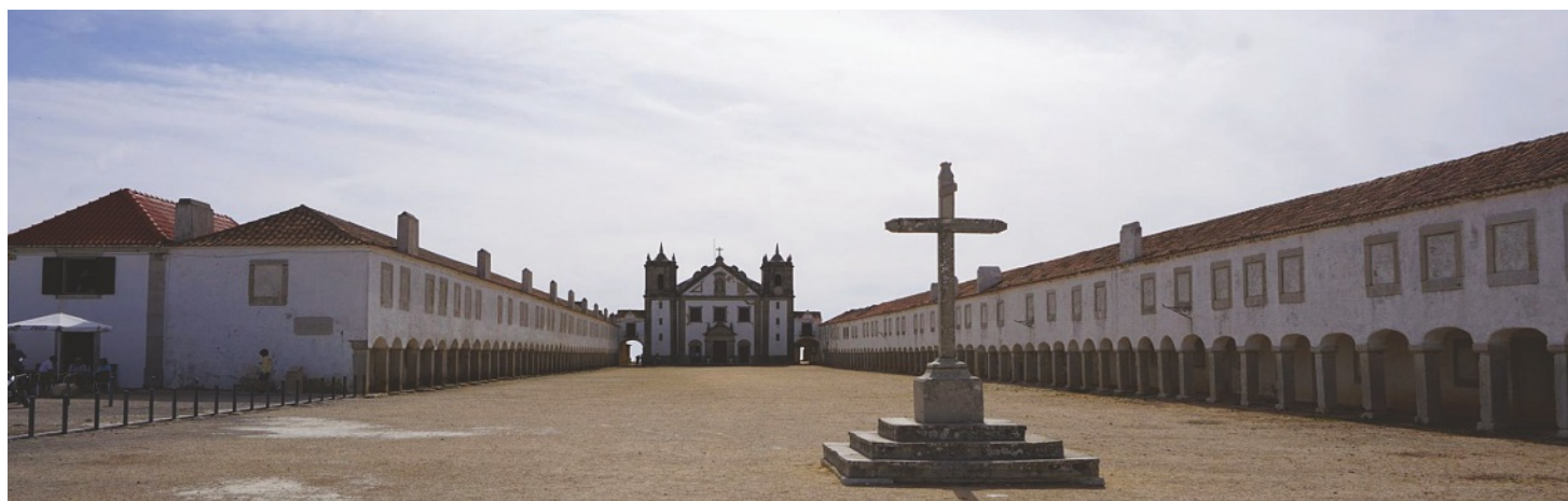
Imposantes Kloster: Das Convento Cabo Espichel.

À ne pas manquer: Ambiance relaxante de la plage à Sesimbra, un but d'excursion populaire, à une petite heure de Lisbonne..