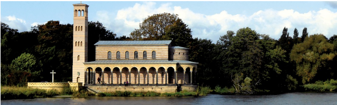
Die Sacrower Heilandskirche entstand 1844 nach Zeichnungen von Friedrich Wilhelm IV. im italienischen Stil mit freistehendem Campanile.