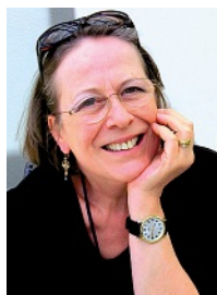
MONIKA UWER-ZÜRCHER REDAKTION DEUTSCHLAND