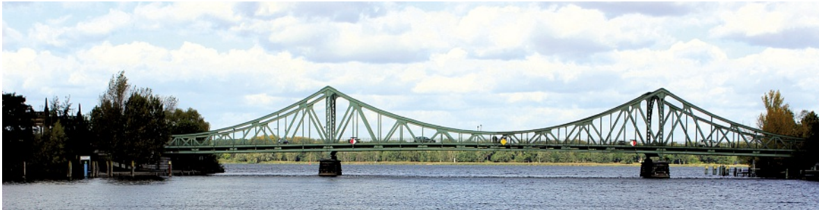
Die Glienicker Brücke verbindet heute wieder Berlin mit Potsdam