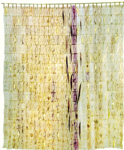
Judith Mundwiler: Seelenwanderung

Das Textil- und Industriemuseum zeigt in seiner Sonderausstellung «Quilt – 22 textile Positionen» bis 28. Juni Werke von 22 deutschen und Schweizer Textilkünstlerinnen.