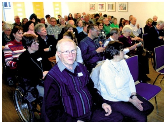
Voller Saal: Insgesamt hundert Zuhörer kamen zum Vortrag über die neue Europäische Erbrechtsverordnung.

Unsere Einladungen gingen nicht nur an die Mitglieder, sondern auch mit Unterstützung des Münchner Generalkonsulats an alle Schweizer in Nürnberg und Umgebung.