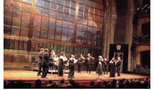
Camerata Bern en el Palacio de Bellas Artes