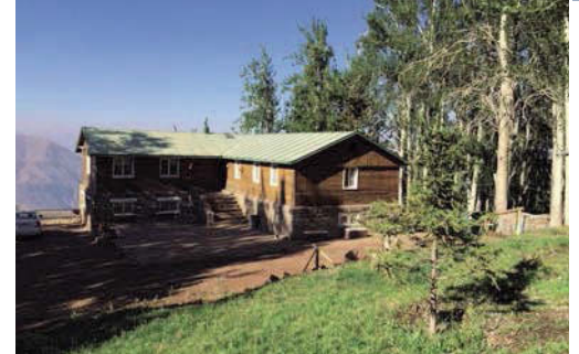
Vistas del Refugio Suizo en invierno y Verano