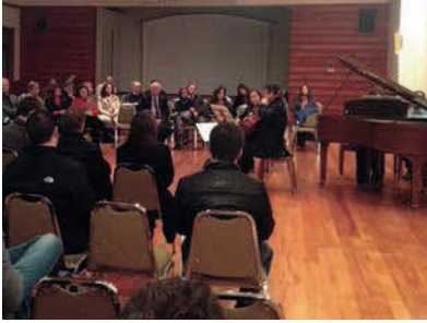
Concierto en el Club Suizo de Santiago