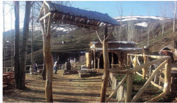
Terraza con vista panorámica

Las personas que mantienen y atienden el refugio son pocas pero conforman un buen equipo de trabajo: Fritz, su pareja Isabel Aros y tres personas más. Fritz ha nacido en Los Alpes suizos, fue montañista y escalador, estuvo en muchos refugios a lo largo de su vida, por estas razones no tiene como objetivo que ese sitio sea un hotel boutique o que acumule 3 ó 4 estrellas, quiere conservar el concepto de refu-