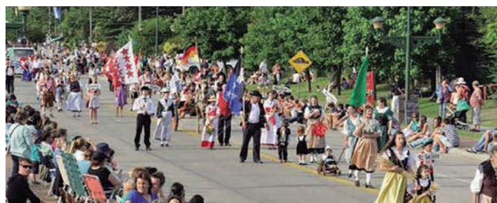
Desfile "Bierfest" 46º edición

Como todos los años, el Movimiento Nuevas Generaciones "Unidad y Progreso", organizó el 14 de diciembre la "Bierfest", tradicional fiesta de la zona, en la que se benefician más de 20 instituciones de la ciudad, entre ellas las escuelas y comisiones de servicios, con lo recaudado por la venta de la variada gastronomía que se ofrece en los distintos kioscos.