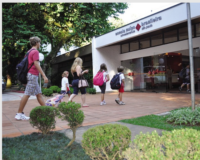
Entrada Escola ES BSP