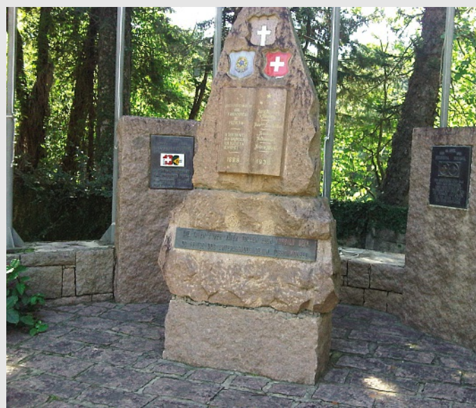
Monumento comemorativo da Colônia Helvetia

Na segunda metade do século 19, a Europa e o Brasil, maior país da América do Sul, viviam profundas transformações. A Europa, ainda imersa nos problemas econômicos e políticos decorrentes das guerras napoleônicas, e o Brasil, deixando de ser imperial para tornar-se uma República e, ainda assim, lidando com os impactos econômicos e sociais da abolição da escravatura. Neste contexto complicado, levas de imigrantes europeus chegam ao Brasil.