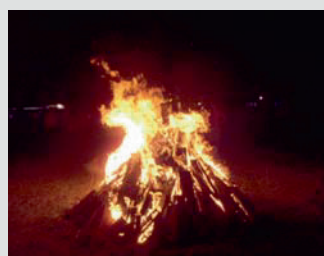
La gran fogata

Los deseos de los niños también se cumplieron con satisfacción: una gran fogata (aunque algunos sufrimos picaduras de hormigas), una caminata con los faroles, cuando ya nos olvidamos de la picazón, canciones y por fin unos lindos fuegos artificiales. Este punto del programa fue apreciado por todos. Después de recoger sus premios de la tómbola y de la música que empezó sonar en vivo, los padres con niños pequeños se retiraron y siguió la parte de los ani-