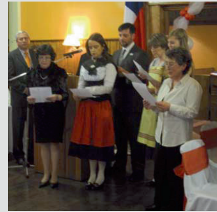
Momento del Himno Suizo

El sábado 4 de agosto se celebró la Fiesta Nacional Suiza en los salones del Club Suizo de Magallanes; asistieron cerca de 150 personas entre socios del Club, descendientes de suizos friburgueses y amigos de la colonia suiza. La celebración comenzó en el Himno Nacional de Chile y a continuación el Himno Nacional de Suiza, que fue acompañado en coro por integrantes del Círculo Suizo.