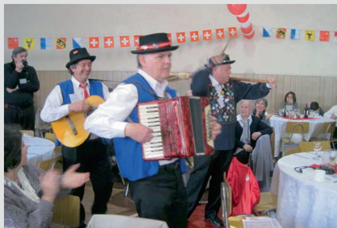
La música alegró el encuentro en Traiguén.

Rousseau fue filósofo, educador, autor, músico y naturalista a la vez, fue también revolucionario y uno de los padres del pensamiento democrático moderno. En una de sus obras llamada El contrato social, aborda muchos de los conceptos que