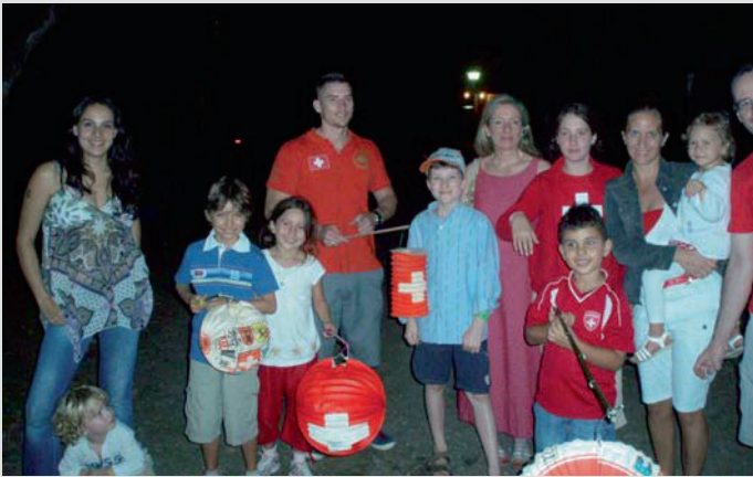
Los niños con sus faroles. En el centro, la Sra. Embajadora

amistades con los diferentes pueblos. Somos representantes en muchas ocasiones y no subestimamos nuestro aporte para un buen entendimiento entre culturas tan diferentes.