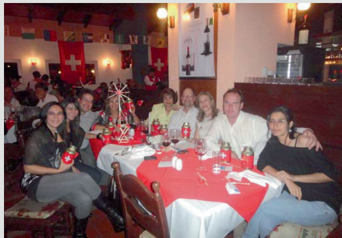
Algunos comensales. Sobre la mesa, el molino construido para la competencia

Con las vibrantes palabras grabadas de la Sra. Presidente del Consejo Federal y el tradicional brindis colectivo, este año se inició la reunión del 1º de agosto, a las 19 hs. Acto seguido, los participantes tuvieron la oportunidad de deleitar sus paladares con una succulenta cena a cargo del chef del Chalet