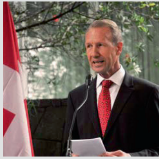
Sr. Rudolf Werner Knoblauch, Embajador de Suiza en México

guiremos con las festividades en el marco de una semana suiza en la Ciudad de México. Del 22 al 27 de octubre, el Zócalo se pintará de rojo y blanco. Con la colaboración del gobierno del Distrito Federal y de las empresas suizas en México, se está preparando esta semana cuya meta es crear más intercambio cultural, culinario, científico, comercial y político entre las dos naciones”.