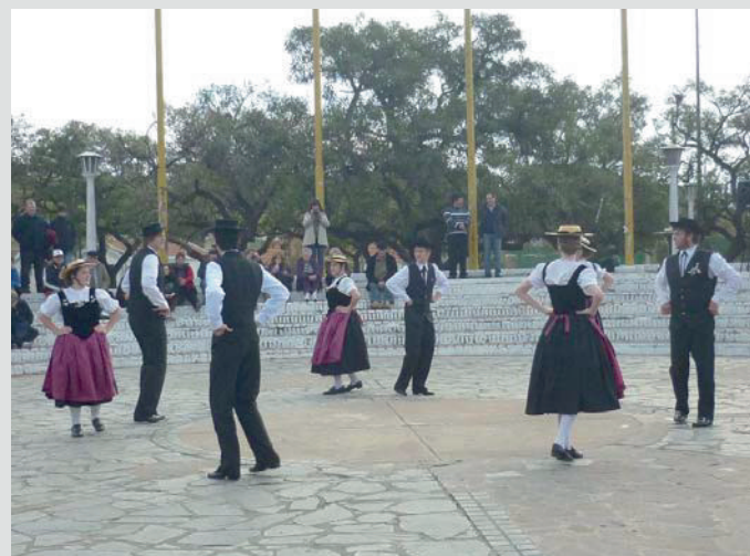
Cuerpo de Baile "Encantos Alpinos"

En su sede de la calle Lavalle 115 en la pintoresca ciudad de