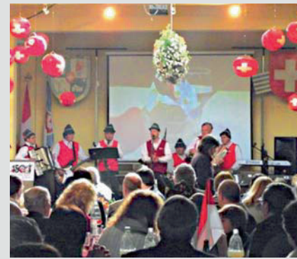
Centro Helvético-5 de agosto

El domingo 5 de agosto, en el marco de los 150 años de la Colonia Suiza y los 721 años de la Confederación Helvética, se realizó el Acto Inauguración de las