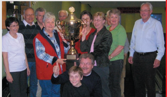
Resultate Kegelabend 2009