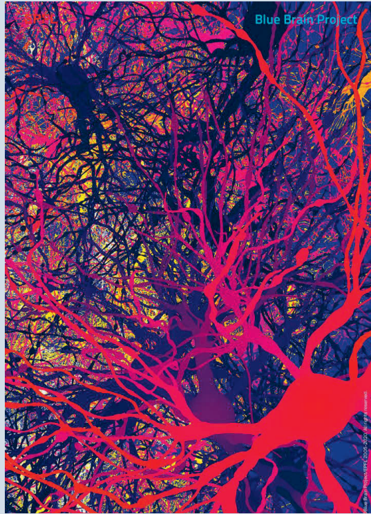
Die «École Polytechnique Fédérale de Lausanne» ist bei der Ausstellung in Madrid ebenfalls mit dabei. - L'École Polytechnique Fédérale de Lausanne est également présente à l'exposition à Madrid