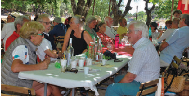
Helvetia Vaucluse Gard