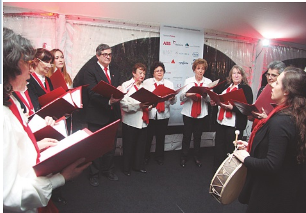
Coro Suizo de Buenos Aires

gastronomía en un clima distendido de celebración y festejo.