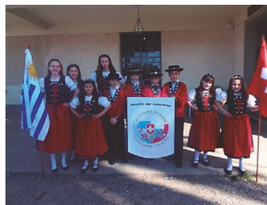
Grupo de danzas “Am Unsere Schweiz”