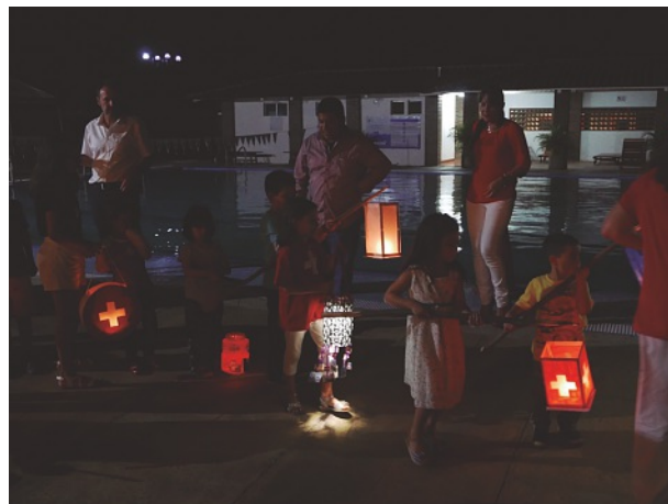
Tradicional desfile de niños y niñas con sus farolitos

Además, hizo referencia a Nicaragua como un país vulnerable ante los desastres provocados por fenómenos naturales, situación que requiere de un equipo de emergencia local (EEL) y de una red de enlaces en todo el país, que apoye al Consulado Suizo en caso de una crisis. Aprovechó el momento para agradecerles a todos los colabora-