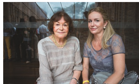
Fotografa Claudia Andujar e Astrid Boller - Cônsul honorária de BH

O Instituto Inhotim, em Brumadinho, próximo a Belo Horizonte, inaugurou no dia 26 de novembro sua 19ª galeria permanente, dedicada a fotografa suíça radicada no Brasil, desde 1955, Claudia Andujar. O pavilhão de 1600m é o segundo maior do parque e exhibe 400 fotografias realizadas pela artista entre 1970 e 2010 na Amazônia e com os índios Yanomami. Claudia Andujar viveu temporadas na região e realizou diversas visitas posteriores. Grande parte das fotografias é inédita, como as séries Rio Negro de 1970 e Toototobi de 2010.