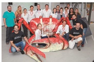
A equipe de Race For Water com a equipe da swissnex e parceiros locais

A swissnex Brazil, e swissando apresentaram, em novembro, no Rio de Janeiro, a Race for WaterOdyssey, expedição que produziu o primeiro levantamento global da