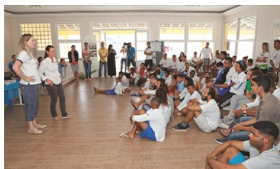
Sensibilização de crianças e jovens em Niterói no Projeto Grael

A chegada da expedição no Rio deu-se início na campanha “Mar sem Lixo. Mar da Gente.”, que teve ações de sensibilização e seminários científicos em torno da causa do lixo nos oceanos no Rio e em Niterói. A swissnex Brazil e