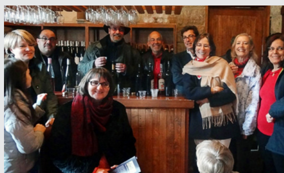
Le premier livre arabe imprimé au Liban / L'enseigne du vin du Monastère Saint-Jean de Khonchara / La dégustation de vin