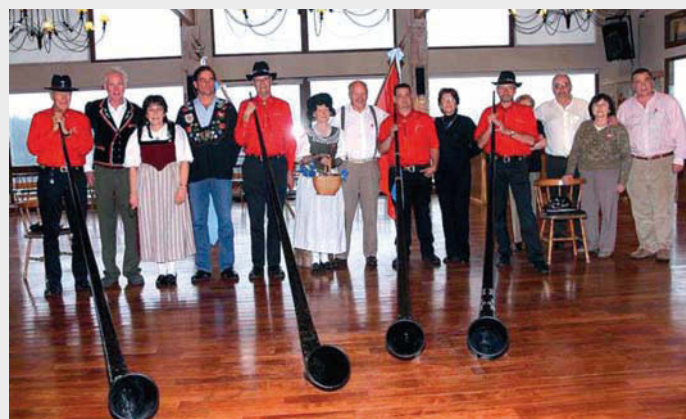
"Alphorn Ensemble Engiadina" y Comisión Directiva, Sociedad Helvética Bariloche

La música y el canto son patrimonios del espíritu, son bienes que crecen cuando más se los reparte. Concepto que coincide con el fin solidario del evento que fue a beneficio de la construcción de la capilla "Maria Madre de la Civilización del Amor"