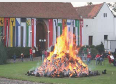
La gran fogata en la Hacienda Panoaya