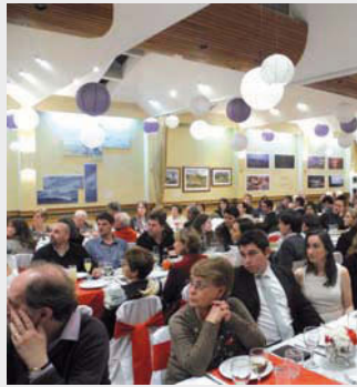
1° de agosto en Santiago

paisajes bordados en hilo. De igual forma, los asistentes tuvieron la oportunidad de probar tiros con réplicas de ballestas del S XIII, cuya tradición se remonta a las antiguas historias del legendario Guillermo Tell.