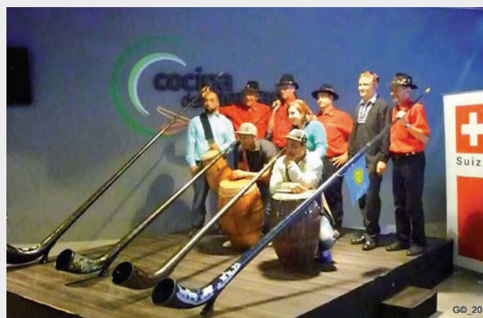
Músicos suizos y uruguayos

La Embajada de Suiza en Uruguay festejó su fiesta nacional con una gran recepción en la residencia del Embajador Didier Pfrter en Montevideo, donde sirvieron Raclette, una de las comidas típicas de Suiza. El evento fue animado musicalmente por el "Engiadina Alphorn Ensemble", oriundo de St. Moritz en Suiza suroriental, que llegó a Montevideo para la celebración de este año. Un día antes la agrupación, cuyo principal instrumento es el "alphorn", tocó en el Mercado Agrícola en Montevideo junto a tres músicos de Candombe, una manifestación cultural que surgió en Montevideo en la época colonial como el principal medio de comunicación de los africanos esclavizados. Crearon una fusión musical