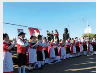
Ballet Schweizer Blumen de San Jerónimo Norte/Santa Fe