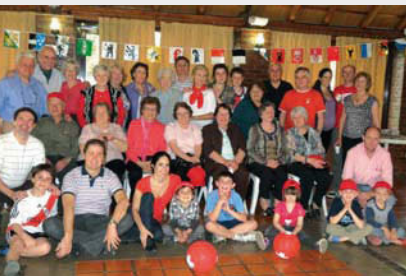
Agrupación "Cantón suizo Maschwitz"

año tras año y las familias comenzaron a crecer y otros amigos, a sumarse. A partir de 2007 buscamos un lugar más amplio para poder incluir a nuestros hijos, nietos y otras familias suizas que comparten nuestro mismo sentimiento. Buscamos un nombre que nos identificara como grupo, teniendo en cuenta el origen de este encuentro. Por votación se eligió el nombre "Cantón Suizo Maschwitz" y creamos un Blog donde registramos nuestras actividades: http://cantonsuizomaschwitz.blogspot.com.ar/