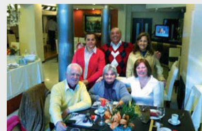
Integrantes de la Asociación Suiza del NOA con Brigitte Wetzel

Queridos amigos de Tucumán: "Deseo agradecerles en primer lugar la cálida bienvenida y vuestro interés en conocernos y acompañarnos en esa primavera mañana en San Miguel de Tucumán. Mi esposo y yo nos sentimos muy halagados y a través de este encuentro, hemos conocido nuevos amigos, que trabajan incansablemente para difundir y estrechar aún más los lazos con Suiza. Ha sido una experiencia muy gratificante y estaré siempre a vuestra disposición para cualquier inquietud o consulta. Un cordial abrazo a todos.