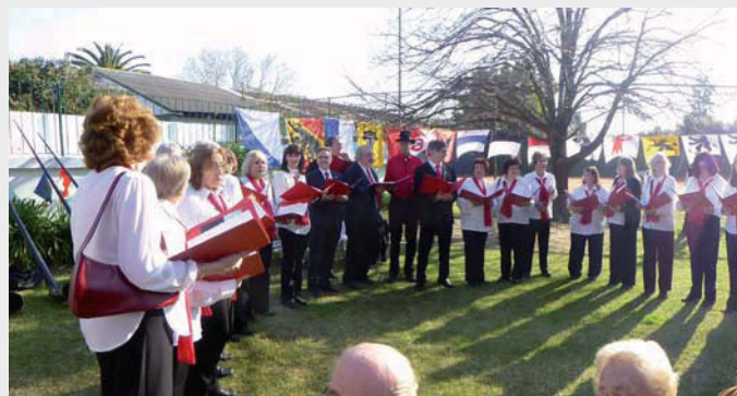
El Coro Suizo de Buenos Aires en el parque del Club Suizo

A continuación el Embajador de Suiza saludó a los presentes y agradeció al Club Suizo y al equipo de la Embajada por la organización del evento, como así también a los sponsors que demostraron una vez más, el com-