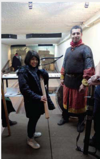
Tiro de ballesta

El programa dio inicio con una recepción y aperitivo en el salón principal, donde se realizó una exposición de obras de artistas suizos en Chile, consistente en fotografías, pinturas, cerámica y