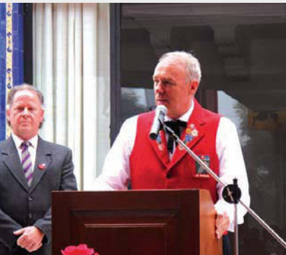
Embajador de Suiza Sr. Hans-Ruedi Bortis

des municipales, regionales y nacionales con el objeto de intercambiar conocimientos y profundizar la amistad entre ambos países.