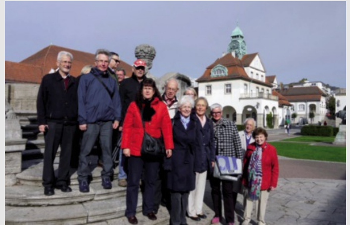
Im Sprudelhof von Bad Nauheim

Die Jugendstilbauten in Bad Nauheim wurden zwischen 1904 und 1912 errichtet. Der Schweizerverein Mittelhessen genoss mit sechzehn Mitgliedern am 13. Oktober eine hochinteressante Führung durch die historischen Bäder.