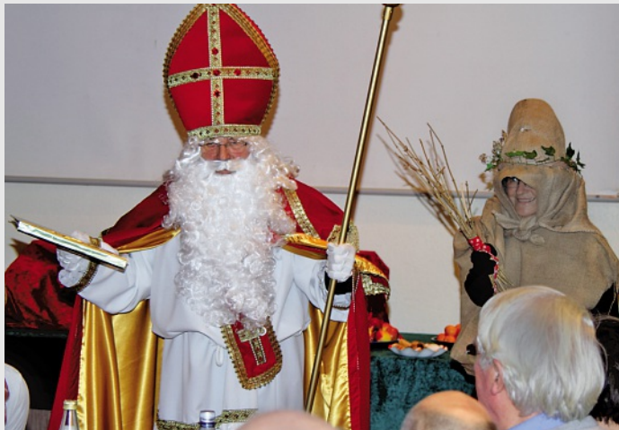
Samichlaus und Schmutzli bei der «Helvetia» Köln