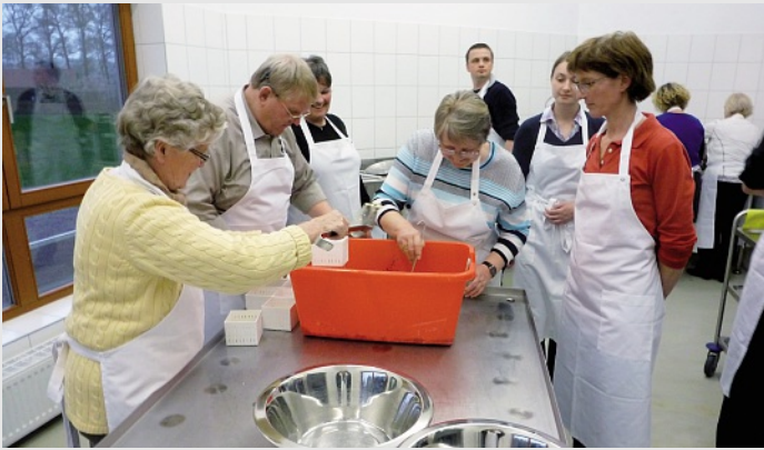
Osnabrücker Schweizer füllen Asprotiri ein, das ist eine Art Hüttenkäse mit Basilikum.

Selten wurde bei einer Veranstaltung des Schweizer Vereins Osnabrück so viel gelacht. Elf Möchtegern-Käserinnen und -Käser standen mit weisser Schürze bewaffnet und voller Ta-tendrang in der Versuchskäseerei des WABE-Zentrums, einer Einrichtung der Fachhochschule Osnabrück.