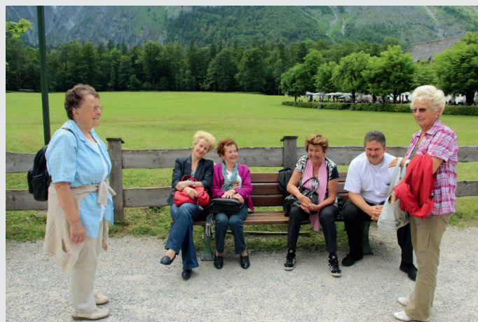
Wir warten auf das Schiff ...