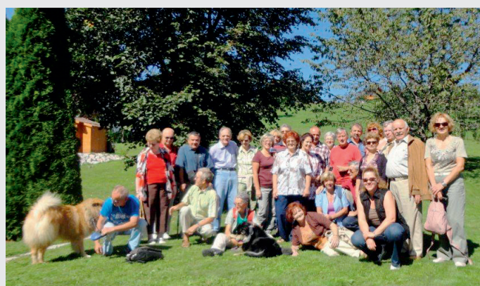
Herbstausflug des Schweizer Klubs Slowenien nach Oberkrain