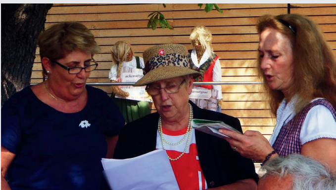
Wo man singt, dort lass dich ruhig nieder ...