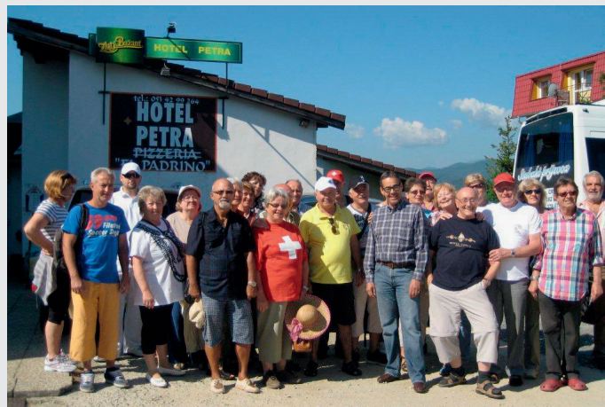
Dreiländertreffen in Hrabušice, Slowakei

Am nächsten Morgen war schon früh Tagwache und das Frühstück erwartete uns bereits um 7.00 Uhr. Es wurde ein toller Ausflug für uns organi-