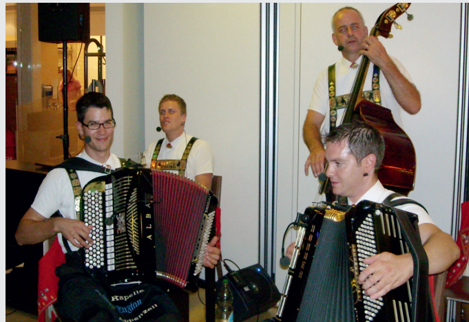
Am Nationalfeiertag durfte auch auf 1800 Höhenmeter eine zünftige Musik nicht fehlen.

Ein Quiz über die Schweiz bringt weiteren Gesprächsstoff und ich bemerke mit Bewunderung, wie viele Fragen unsere Landsleute aber auch – und besonders – die Schweizer Kinder beantworten können!