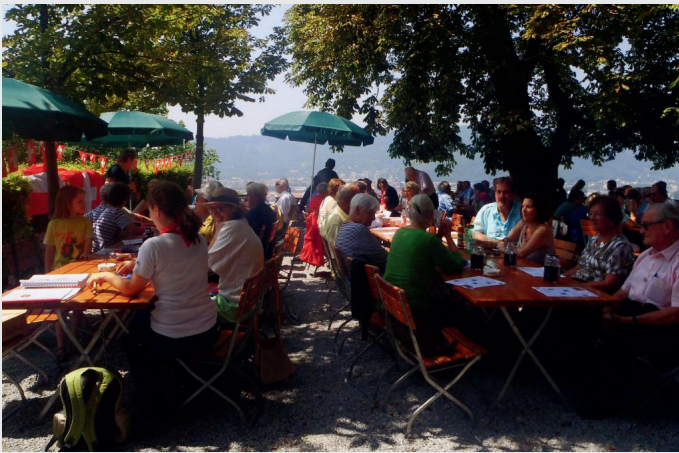
Herrliches Wetter und herrliche Stimmung am Grazer Schlossberg