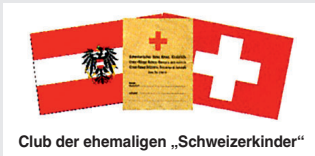
Club der ehemaligen „Schweizerkinder“

Nach mehr als einem Jahr intensiver Vorbereitungsarbeiten war es am 7. September 2012 endlich so weit – eine Gedenktafel der ehemaligen „Schweizerkinder“ ihrer Bestimmung zu übergeben. Der Herkulesaal des Gartenpalais Liechtenstein, in dem vor fast siebenzig Jahren die von Hunger und Krankheit gezeichneten Kinder aus Österreich für ihre Reise zu Pflegefamilien in die Schweiz und nach Liechtenstein versammelt wurden, war festlich geschmückt und bildete den würdevollen Rahmen für die Veranstaltung.