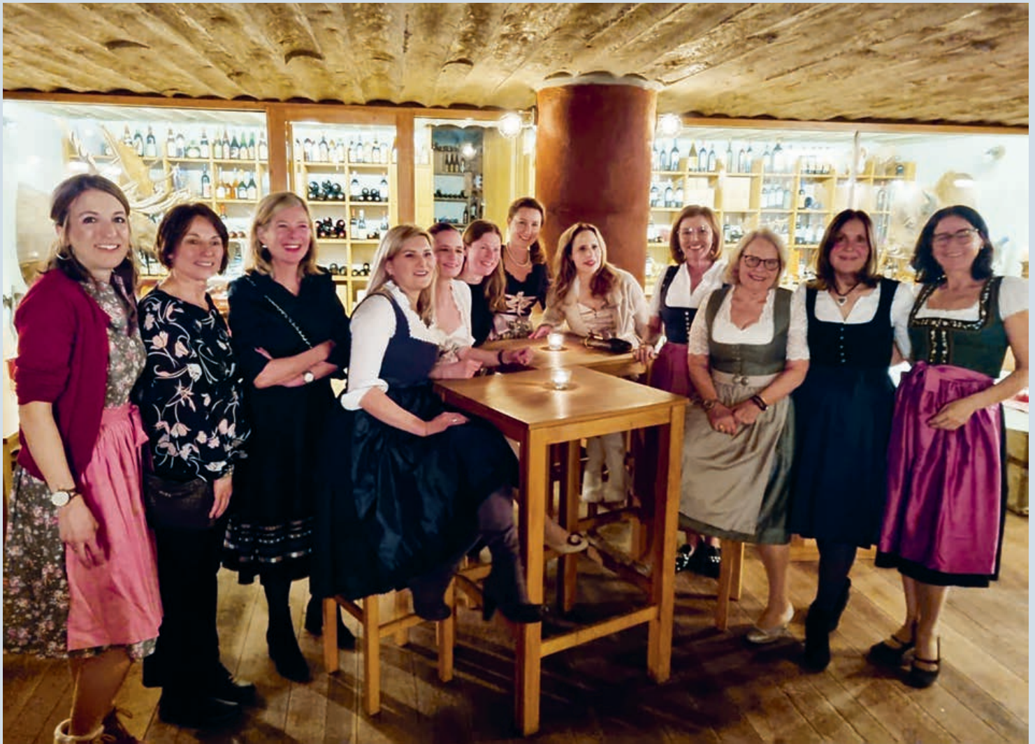
Fesche Mädels im Dirndl