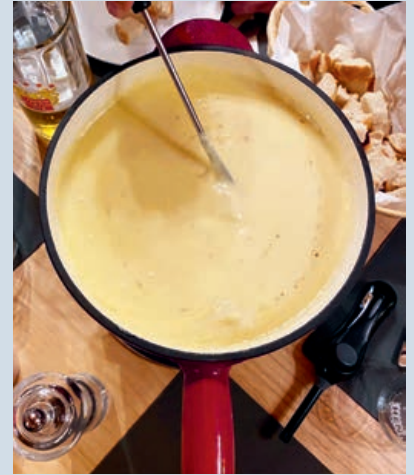
Fondue im Alpenhotel Vögeli, Malbun