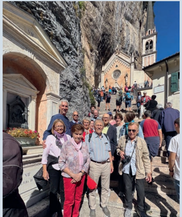
Links oben und oben: Die in den Fels des Monte Baldo Massivs hineingebaute Kirche hoch über dem Etschtal in 774 m.ü.M.