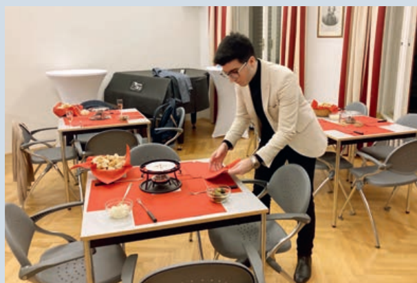
Eifrige Vorbereitungen für das Fondue-Essen

Fondue-Essen , das am 16. November 2023 in unserem Clublokal in der Schwindgasse stattfand. Und es bewahr-