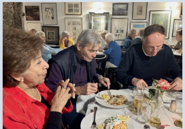
Faszinierende Kunstwerke in der Piano Bar

Kuchen sowie einem exzellentem Tiramisu ein. Von uns allen nochmals vielen herzlichen Dank!