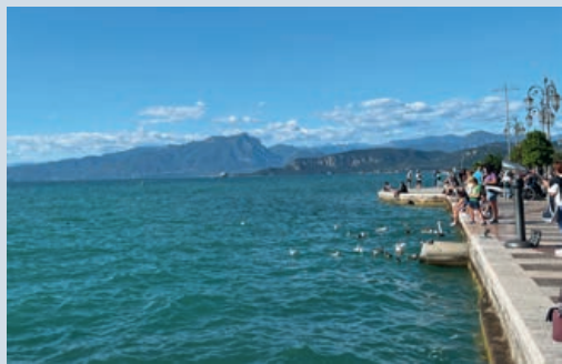
Lazise am Gardasee