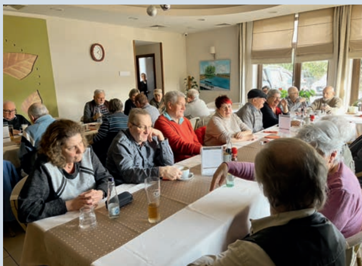
Stammtisch der Balaton-Schweizer

Weiterhin führen wir ein aktives Klubleben, welches von unserer stetig wachsenden Gemeinschaft getragen wird. Wir pflegen den aktiven und geselligen Kontakt unter den deutschsprachigen Aus-