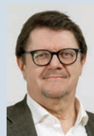
IVO DÜRR, REDAKTION

Zuguterletzt möchte ich noch auf einen besonderen Event hinweisen: Die Jungbürgerfeier, zu der unsere volljährig werdenden Schweizer Jugendlichen von der Schweizerischen Botschaft in Wien im Juni erstmals eingeladen werden. Vielleicht haben Sie Jungschweizer/innen in der Familie oder im Umfeld? Machen Sie sie darauf aufmerksam! Näheres dazu finden Sie auf der folgenden Seite.