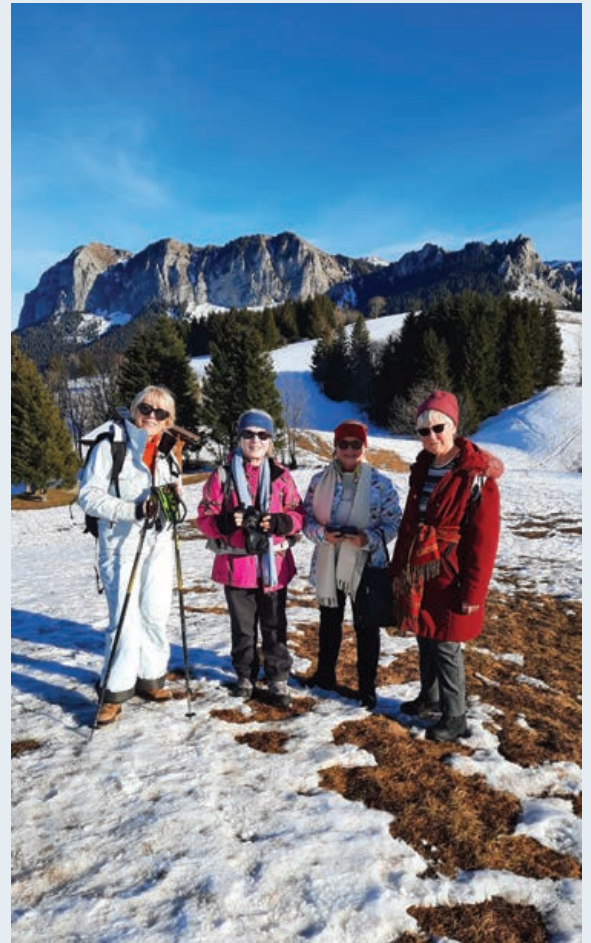
Photo prise à Bernex au-dessus d'Evian-les-Bains lors d'une petite randonnée dans la neige organisée par l'amicale.