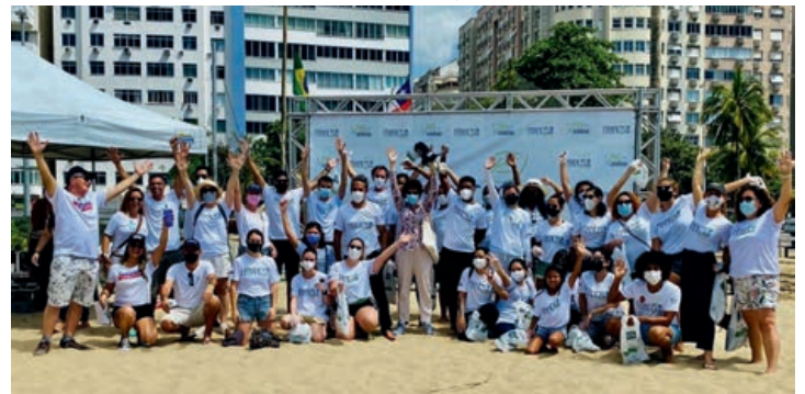
Francecolab na praia de Copacabana

Estar em um ambiente rodeado de jovens com ideias brilhantes