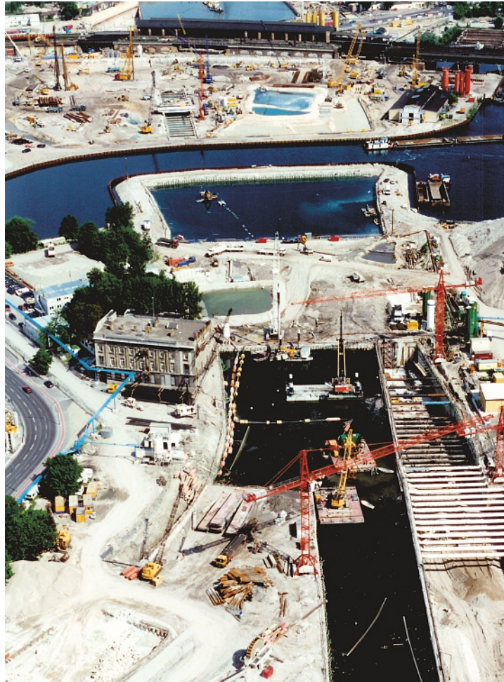
1997: Der Spreebogen während des Baus des neuen Regierungsviertels und des Bahntunnels zum Lehrter Bahnhof. In der linken Bildhälfte ist das Gebäude der Botschaft zu sehen.

Die diplomatische Vertretung der BRD wurde 1949 in Bonn eingerichtet und war von 1957–1977