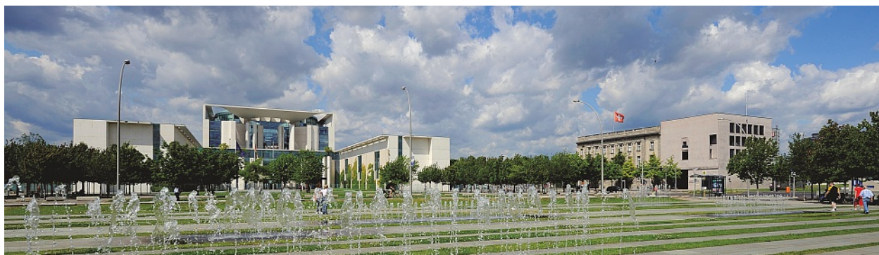
Die Schweizerische Botschaft direkt neben dem Bundeskanzleramt