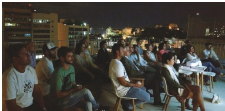
Apresentação do documentário Uma Gota, no terraço da swissnex.