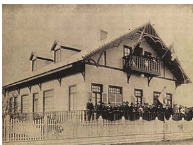
Círculo Suizo ayer y hoy