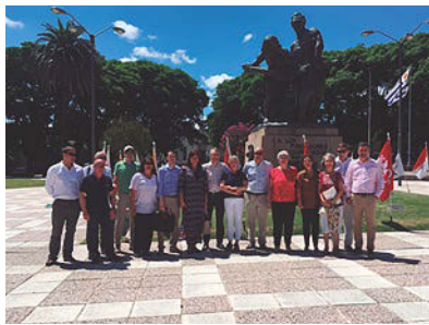
Delegación suiza y autoridades locales en la Plaza de los Fundadores