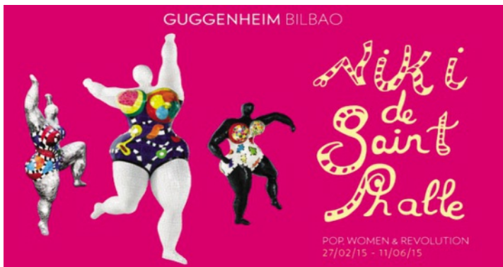
Affiche de l'exposition de Niki de Saint Phalle.

■ Guggenheim Bilbao Abandoibarra Etorb 2, 48001 Bilbao, Spanien