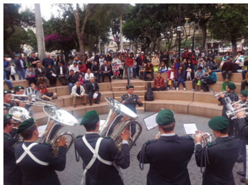
Banda Militar Suizo en el anfiteatro de la Plaza Central de Miraflores