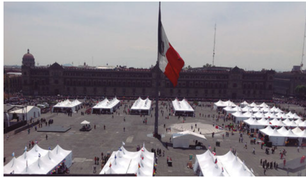
Vista general de la Feria de las Culturas Amigas