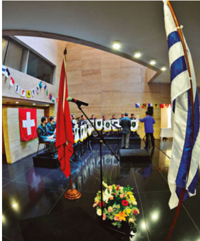
Banda Militar Suiza en el Auditorio Nacional.