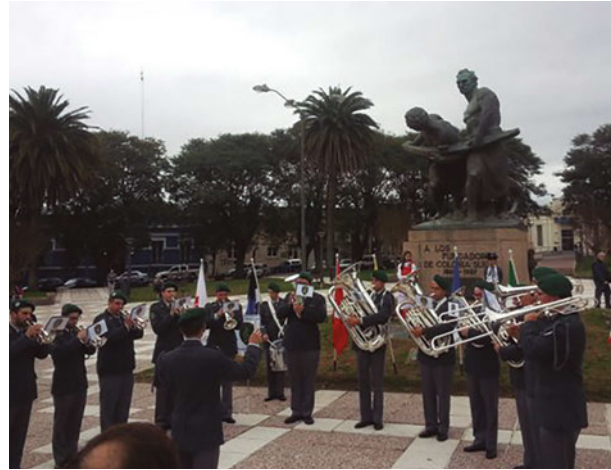
Actuación de la "Swiss Army Brass Band" en la Plaza de los Fundadores