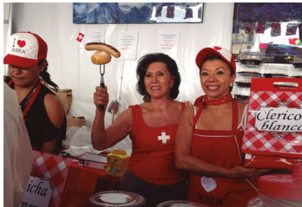
Venta de salchichas en el stand de Suiza

Al frente, el Palacio Nacional, sede del Gobierno de México cuya historia se remonta al Palacio de Moctezuma que ocupaba exactamente la misma extensión del edificio actual. Sobre sus ruinas, tras su destrucción durante la Guerra de Conquista de Tenochtitlan, Hernán Cortés mandó construir un gran palacio, que décadas más tarde sería vendido por su hijo Martín Cor-