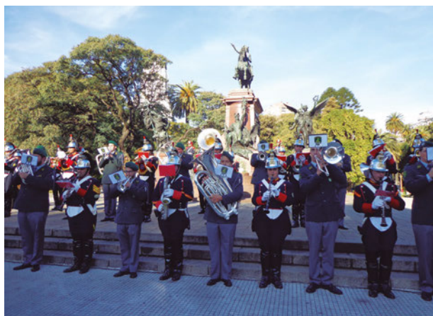
Bandas Militares de Suiza y Argentina unidas en la interpretación de un tango