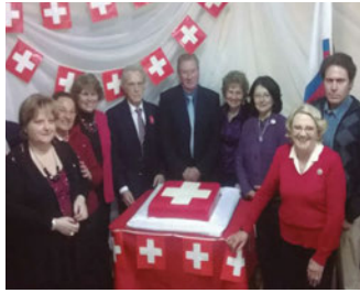
Comisión Directiva Sociedad Suiza de Paysandú

por razones económicas, militares y de ayuda mutua el 1º de agosto de 1291, se unieron y fundaron la Confederación Helvética; a través del tiempo se fueron agregando otros, sumando actualmente los 26 cantones que constituyen la actual República Federal.