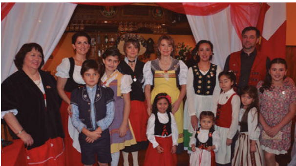
Niños y adultos con trajes típicos en el festejo del Círculo Suizo de Magallanes