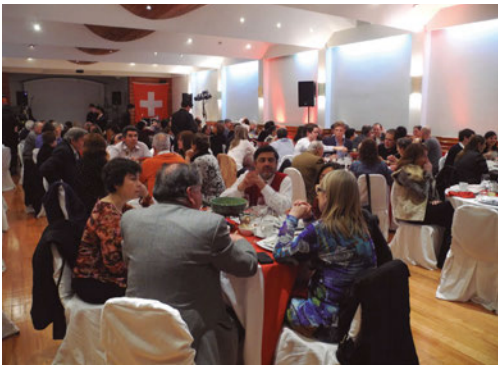
Socios y amigos del Club Suizo de Santiago

MARÍA INÉS BAERISWYL RADA