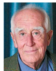
PETER BICKEL, REDAKTION

Das R-KC Wien und seine rundherum gruppierten Mitglieder.