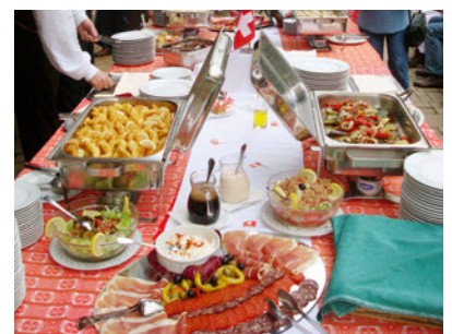
Apero riche – reichlich gedeckter Tisch