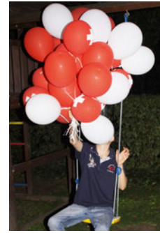
Impressionen vom 1. August im Palace Zofin in Prag.

Gäste Schweizer Spezialitäten genießen, Bratwürste und Cervelats, Raclette, Schweizer Wein, Salat- und Fleischbuffets und zum ersten Mal gab es auch Risotto. Eine zweistöckige Torte in Form einer Schweizer Fahne folgte als süßer Abschluss des Festmahls.