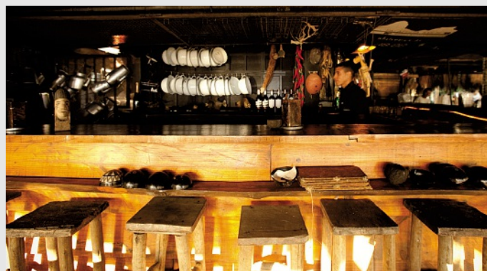
Palaphita Kitch

Queremos apresentar uma Suíça com a qual todos possam se identificar. É a hora de mostrar para os brasileiros que qualidade e precisão não precisam ser enfadonhas e que a informalidade combina com a sofisticação. Com esse projeto, temos a melhor oportunidade e visibilidade para fortalecer a sinergia entre o Brasil e a Suíça de uma forma positiva.