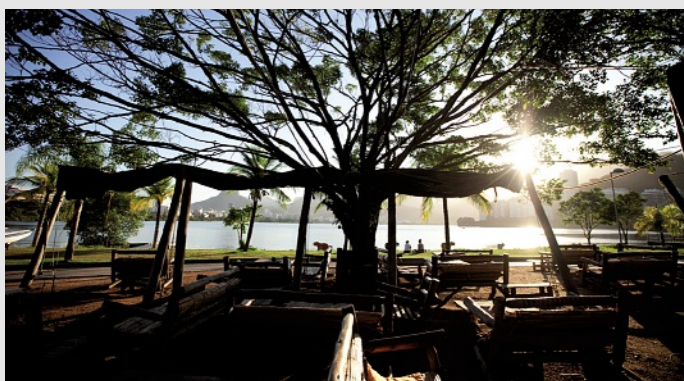
Palaphita Kitch

Com a participação da seleção suíça na Copa, o país das montanhas, do chocolate e dos relógios, oferece a Casa da Suíça durante os 25 dias do evento, com o objetivo de promover a sinergia da emoção e do glamour tropical brasileiro com a qualidade e a sofisticação suíça, no espaço do badalado restaurante Palaphita Kitch na Lagoa.