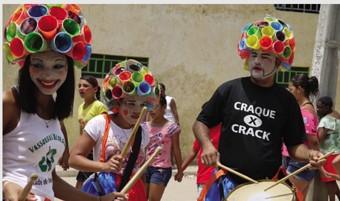
No Dia das Crianças 2012, jovens e colaboradores do GCASC organizaram um evento para as crianças da comunidade. O T-Shirt Craque x Crack refere a uma campanha do GCASC contra drogas.

A contribuição financeira da terre des hommes schweiz ao Centro Sabiá possibilita o apoio a mais de 3.000 jovens e suas famílias. Neste momento, quando ocorre a maior estiagem dos últimos 30 anos no semi-árido nordestino, as famílias usando os Sistemas Agroflorestais e as cisternas conseguem manter um bom nível de convivência com a seca e manter um mínimo de produção agrícola. A parceria com a ASA - Articulação do Semi-Árido, que reúne cerca de 800 organizações, tem sido fundamental para o êxito das ações no semiárido nordestino, principalmente por meio do Programa 1 Milhão de Cisternas (P1MC).