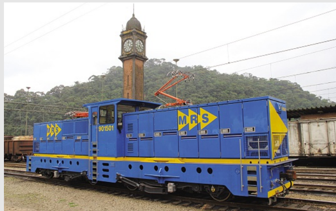
A nova locomotiva da Stadler que irá operar na Serra do Mar / SP

As locomotivas, fabricadas na Suíça, são chamadas de “cremalheiras” e possuem um sistema especial de engrenagens conectadas a um trilho dentado e motores, que freiam as composições na descida e alavancam na subida da serra.