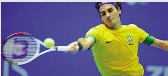
Para seu jogo contra o alemão Tommy Haas em São Paulo, Roger Federer vestiu a camisa 10 da seleção brasileira... de futebol!

Ao ser questionado sobre a vinda ao Brasil, durante partida que realizou com Serena Williams para cerca de 30 crianças do projeto Clube Escola, disse que seu objetivo é promover o tênis no país: "Acho ótimo jogar para crianças e poder inspirá-las, esta é a razão para estarmos aqui".