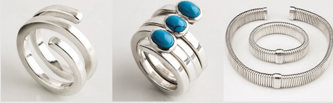
Duas criações de Ana Berredo: o Anel Ajuste, que pode ser usado sozinho ou se encaixar com outro anel com pedras de turquesa, e o Colar Serpente que se transforma em duas pulseiras.

ou por telefone (21 / 9604 0575 ou 2287 1178) para agendar uma visita ao seu atelier.