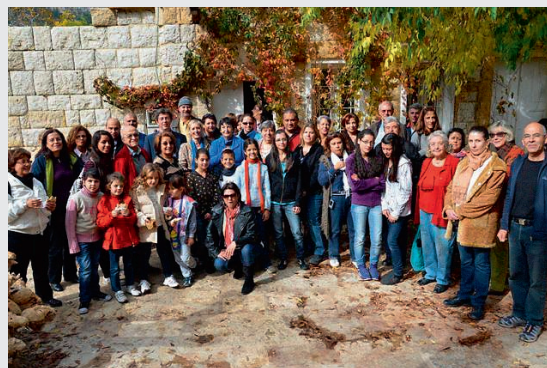
Le groupe lors de l'excursion à Douma

phétique, en 1904 – n'est plus le même. Une guerre a passé, laissant de profondes séquelles, générant une anarchie dans le domaine de l'environnement en particulier. Grâce à Douma, je sais que des bouts de Paradis existent encore au Liban. Merci aux Amis suisses du Liban de m'avoir fait connaître ce village.