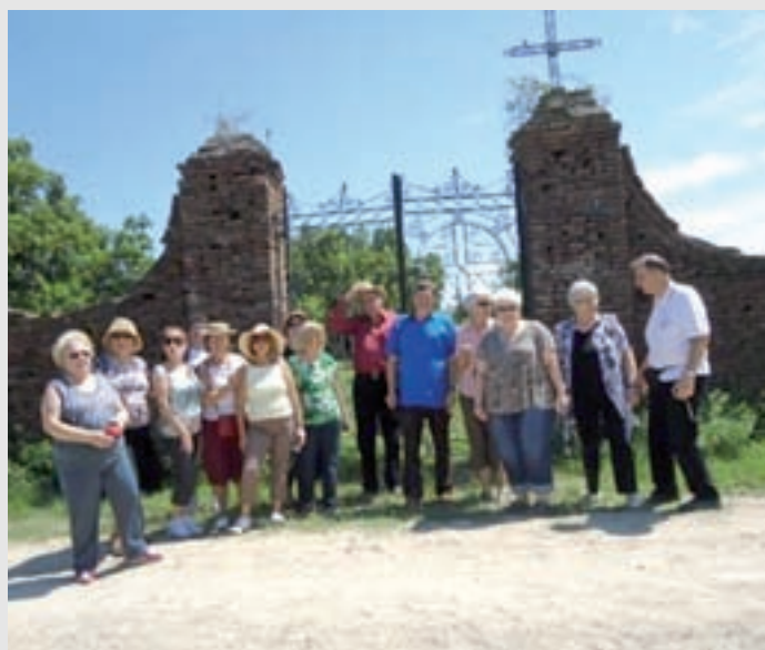
Visita a Villa Urquiza 6-03-2011