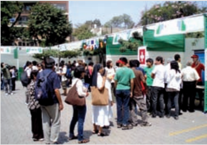
Stand de la Embajada de Suiza-Puertas abiertas del Goethe-Institut

Lima el pasado 2 de abril con el fin de familiarizarse con la cultura de habla alemana. Entre los países invitados se destacó el stand de la Embajada de Suiza que fue una de las principales atracciones del día. Las generaciones más jóvenes acudieron para solicitar información sobre las oportunidades universitarias en Suiza. Bolsas y viseras con los colores de Suiza distribuidos en el stand formaron una ola roja en el patio del Goethe-Institut.