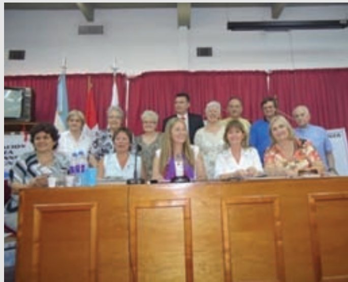
Acto Central 5-03-2011