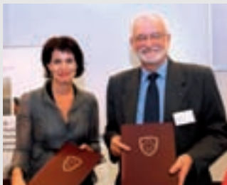
Doris Leuthard y Antonio Brack

competencias y capacidad de respuesta ante los desafíos del cambio climático. Además lograron un convenio sobre capacitación para procesar basura electrónica.