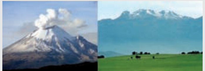
Vista panorámica de los volcanes Iztaccihuatl y Popocatepetl

Por tercer año consecutivo, la Fiesta Nacional Suiza se llevó a cabo en la histórica Hacienda Panoaya, en Amecameca, al pie de los volcanes Iztaccihuatl y Popocatepetl. Asistieron 850 personas, de las cuales 142 fueron niños. Los invitados llegaron desde muy temprano, tomando