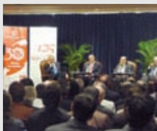
Imagen de la Jornada Económica

El pasado 6 de agosto, en el Swissôtel de Lima, 250 personas acudieron a la Jornada Económica sobre el tema "Oportunidades y Responsabilidades de los