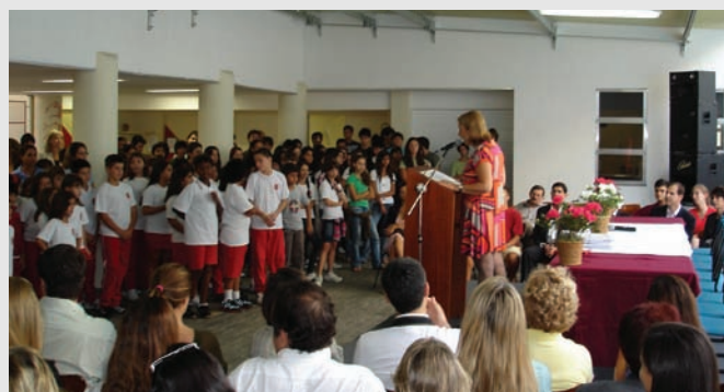
A emocionante cerimônia de entrega dos diplomas de língua estrangeira.

Por tudo isto, nossa Comunidade Escolar, vem recebendo, por parte dos pais e alunos, um reconhecimento pelo trabalho que vem sendo desenvolvido o que deixa o nosso corpo Docente muito recompensado, e nos leva a cada dia a nos empenharmos mais para a realização do nosso trabalho.