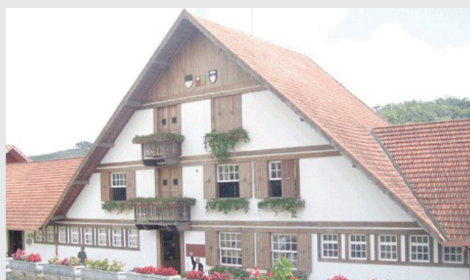
A bela « Casa Suíça » onde funciona a queijaria suíça, sede brasileira do Instituto Fribourg-Nova Friburgo.